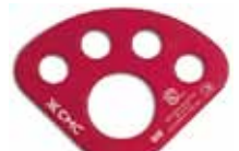
アンカープレート アルミレッド