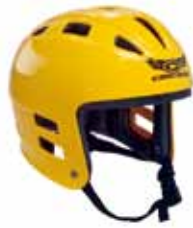
カスケード スイフトウォーター ヘルメット※