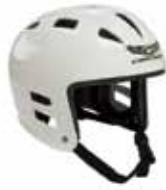
カスケード スイフトウォーター ヘルメット※