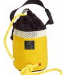
イージースタッフ NFPAスローライン バッグセット