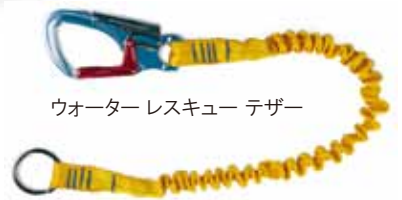
ウォーターレスキュー テザー