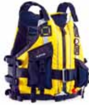
NRS ラピッド レスキュー PFD