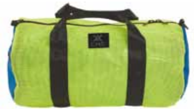
ダブルバッグ メッシュスモール