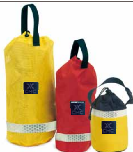
メッシュ バッククロス イーゼースタッフ

材 質：バッククロスとイーゼースタッフの材質は、ナイロンより水分が浸透しにくいポリエステルです。