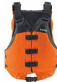
NRS ビッグウォーターV PFD