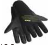
NRS ユーティリティグローブ※