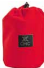
スタッフバッグ スモールレッド