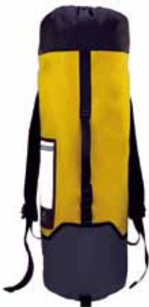
#2 ロープバッグ イエロー