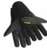
NRS ユーティリティグローブ※