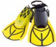
USダイバーズ SAR スイムフィン