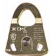
プロテック プーリー シングル