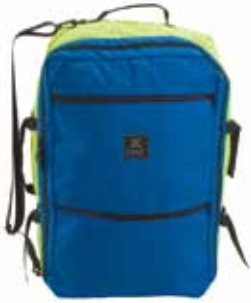
ウォーターレスキュー ギアバッグ