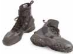
NRS ワークブーツ ウェットシュー※