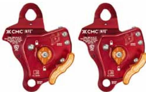
MPD (※MPD Lに変更可)