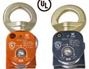
アズテック オムニ オレンジ