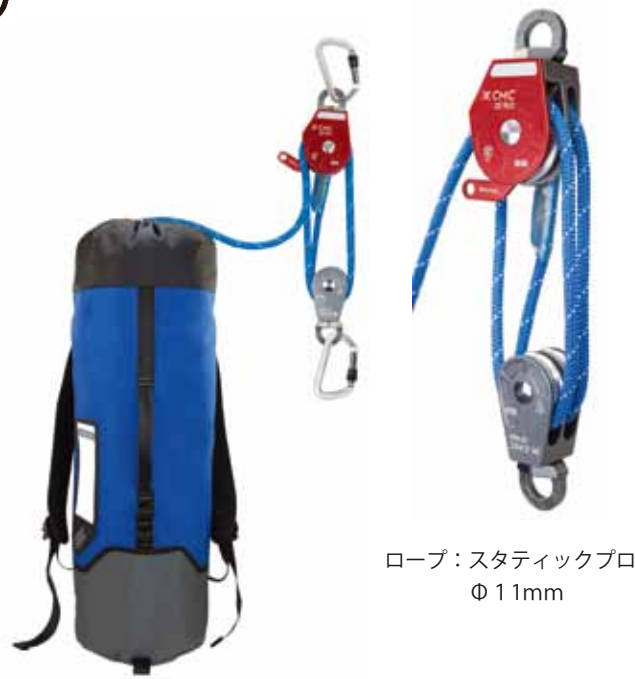
ロープ：スタティックプロ Φ 11mm