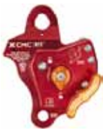
MPD × 2 (※MPD Lに変更可)