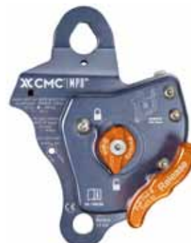
MPD L 11mm