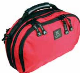
MPD/クラッチ ツインバッグ