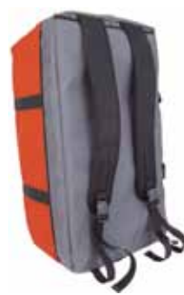
シャスタギアバッグ レッド