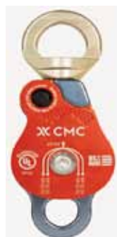
プロスイベルプーリー ダブル