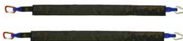
ファストリンクアンカーストラップ M & アンカーストラップスリーブ M