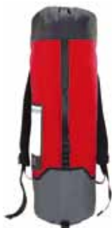
# 2 ローブバッグ レッド