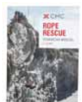
ロープレスキューマニュアル