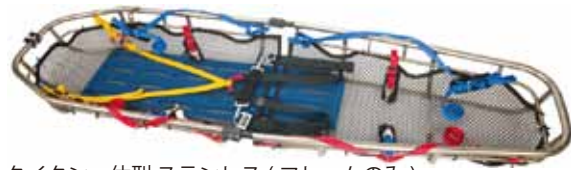
タイタンー体型 ステンレス (フレームのみ) リッターインサートメッシュ タインシステム 一体型用 タインシステム ペルビックハーネス