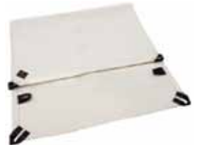
エッジパッド XL × 2