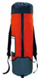
# 2 ローブバッグ オレンジ