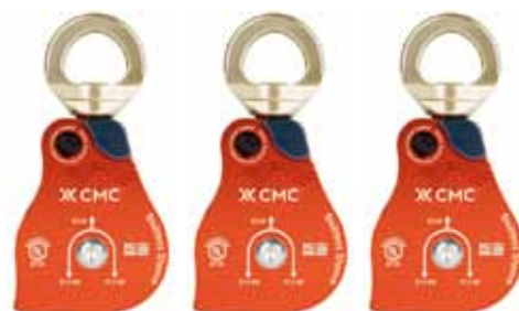
プロスイベルプーリー シングル