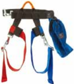
ビクティム ハーネス