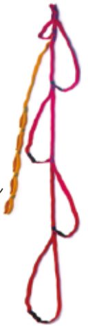
エトリエ ウィズタイン レッド