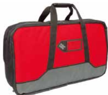
トラックコーチケース