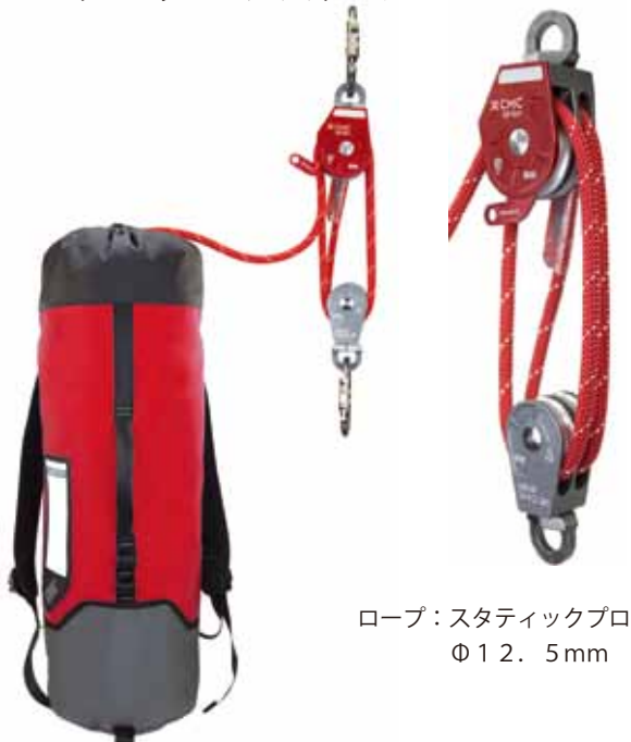
ロープ：スタティックプロ Φ 12.5mm