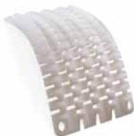
ウルトラプロ4エッチ プロテクター