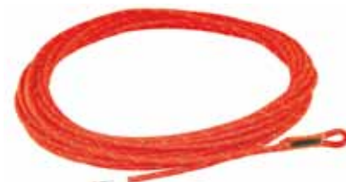
アズテック コード Φ8mm アイ付 15m