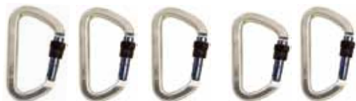
スクリュロックカラビナ