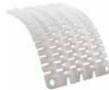
ウルトラプロ 4エッジ プロテクター