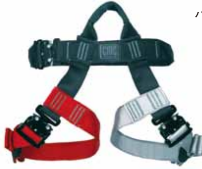
ハーネス タイン ポイント