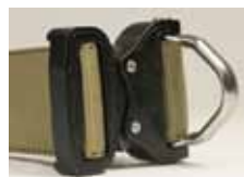
コブラバックル &amp; Dリング