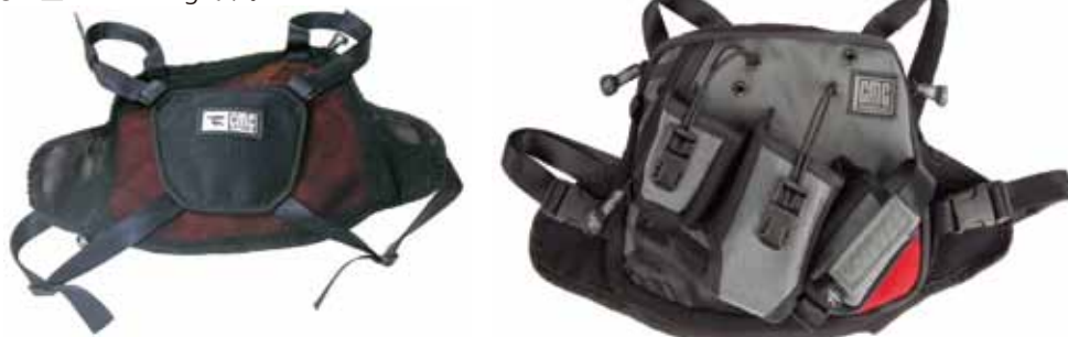
背面は通気性のよいメッシュ