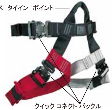
クイックコネクタブックル