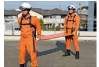
スクープ エクセル