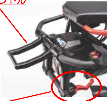
⑦ マニュアル操作レバー