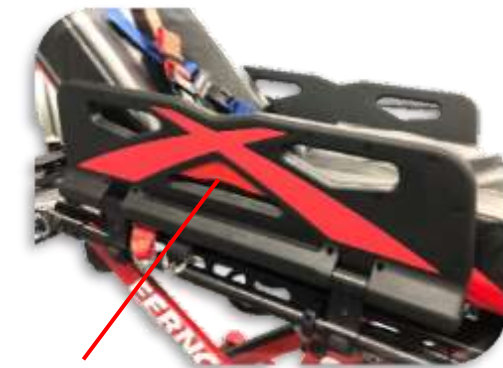
③ 調節式サイドアーム