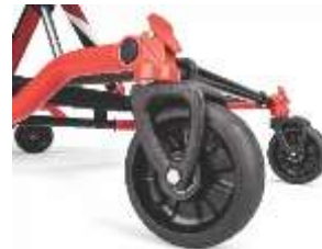
⑤ ブレーキペダル&ホイール

幅の広い6インチホイールの 採用により、起伏の多い路面 でも安定した走行が行えます