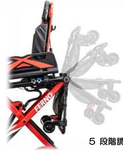
② 可倒式アーゴフレーム