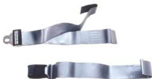
2ピース 金属バックル タイプ 5フィート