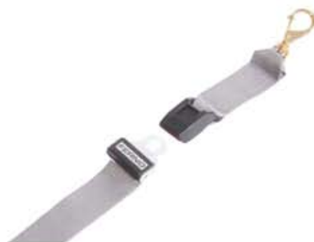
スピードクリップ 金属バックル タイプ 5フィート