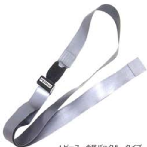
1ピース 金属バックル タイプ 7フィート