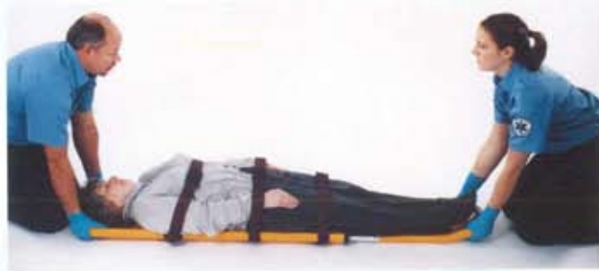
左右の羽根ですくうようにして収納します。