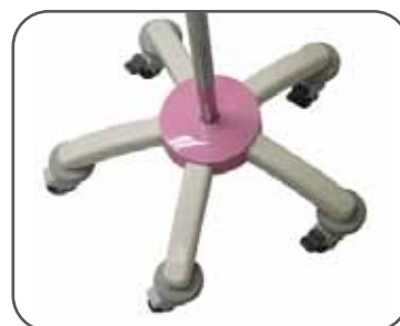
3輪ロック付キャスター